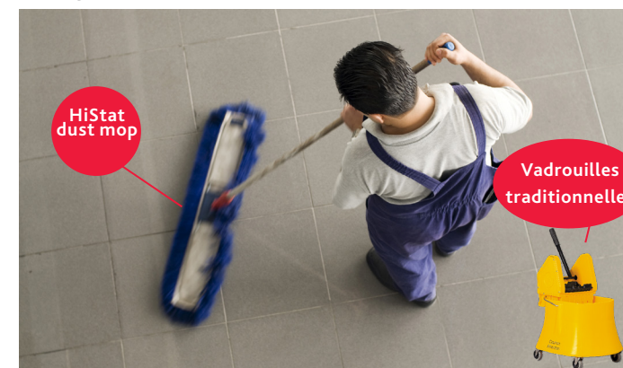
HiStat dust mop

Un nettoyage régulier et méticuleux est essentiel pour prévenir et contrôler la propagation des infections dans les. Il est important de garder les surfaces visiblement propres et de ramasser rapidement les déversements. Nettoyer signifie enlever physiquement de façon manuelle toute la saleté visible d'une surface ou d'un objet. Ceci se fait avec de l'eau, des détergents et de « l'huile de coude » (c.-à-d., en frottant vigoureusement). La désinfection de faible niveau est un processus qui tue la plupart des germes une fois qu'une surface ou un objet a été nettoyé. Certains produits combinent un nettoyant et un désinfectant.