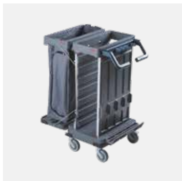
C-B Origo 2 - 536214